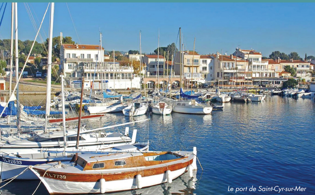
Le port de Saint-Cyr-sur-Mer